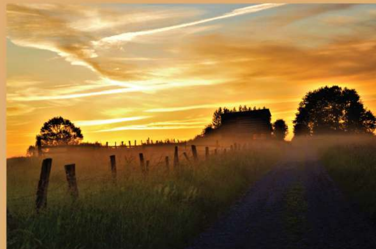
Chemin des Romains / Weg der Romeinen