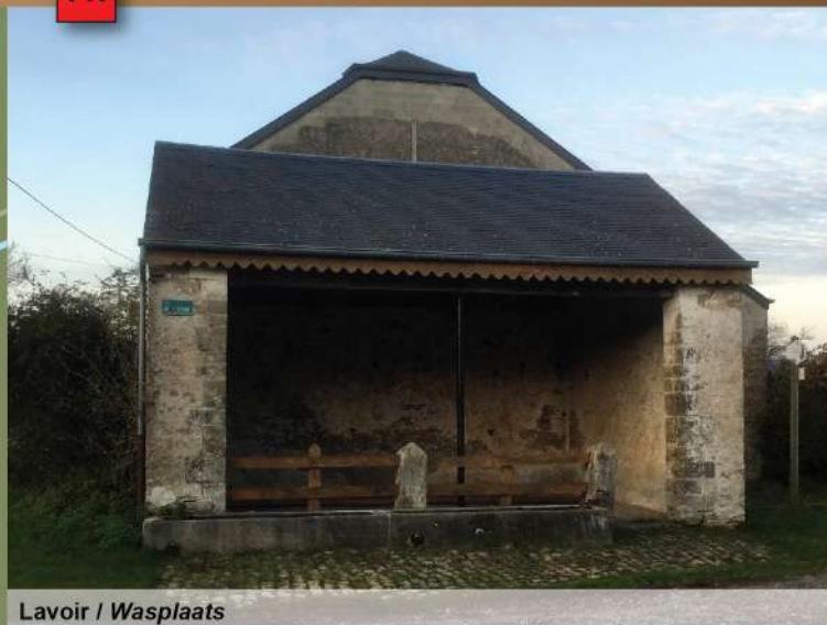
Lavoir / Wasplaats