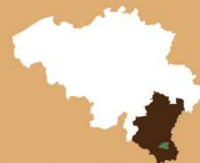
Luxembourg belge Belgisch Luxemburg

Deze kerk werd in 1832 gebouwd teneinde de afhankelijkheid van Houdemont ten opzichte van de parochie van Villers-sur-Semois te beëindigen. Dit bouwwerk was kleiner dan de huidige kerk en had een rieten dak. De toren werd pas in 1852 gebouwd toen de kerk vergroot werd tot de huidige dimensies.