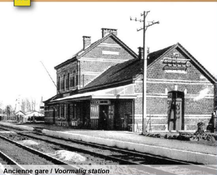
Ancienne gare / Voormalig station