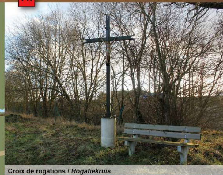
Croix de rogations / Rogatiekruis