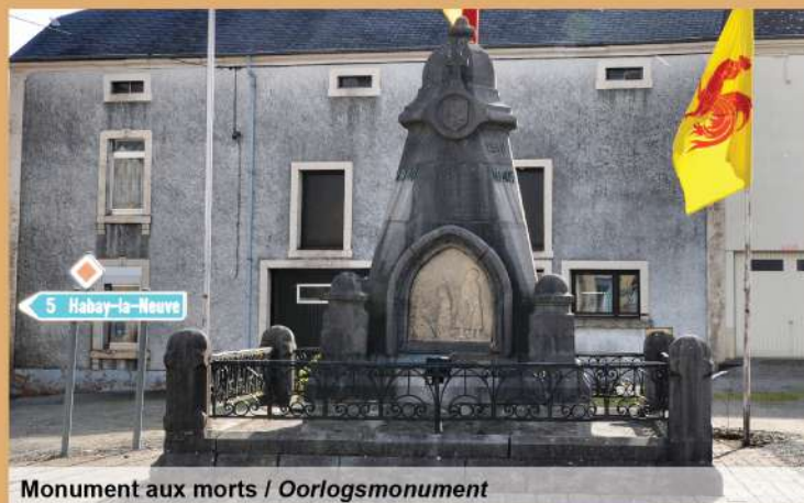
Monument aux morts / Oorlogsmonument

Dit kruis werd op het einde van de 19 de eeuw gedateerd. De processie bestond eruit bij elk kruis stil te staan teneinde aan God de bescherming van de oogsten tegen de natuurlijke rampen te vragen. Identieke kruizen zijn te vinden in Rulles en Hachy.