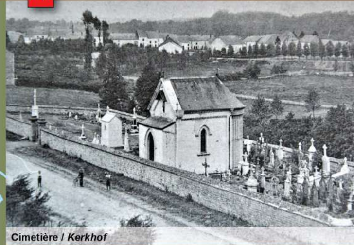
Cimetière / Kerkhof