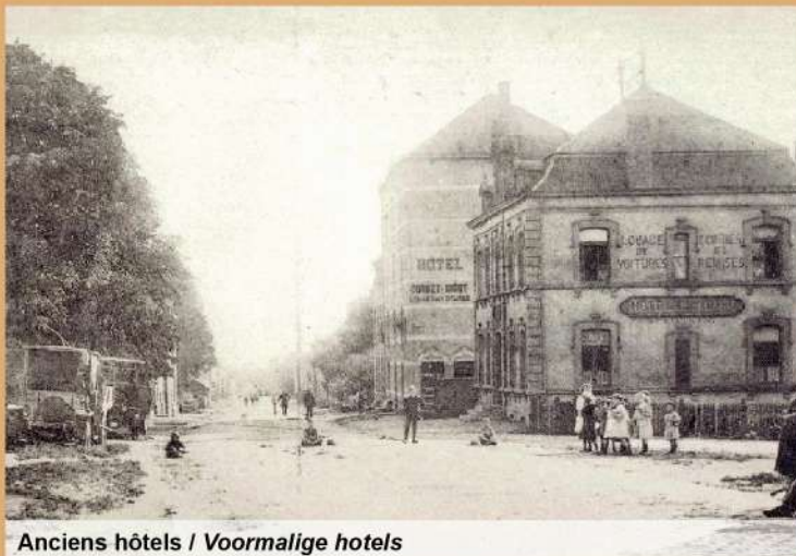
Anciens hôtels / Voormalige hotels

Deze wasplaats werd gebouwd in 1896 volgens hetzelfde plan datgene van Rulles. In 1983 werd deze door het Waals Gewest geklasseerd. De uitbreiding in 2012 werd verwezenlijkt in overeenstemming met de erfgoedkenmerken. Vandaag de dag dient dit als dorpszaal.