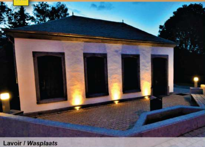
Lavoir / Wasplaats