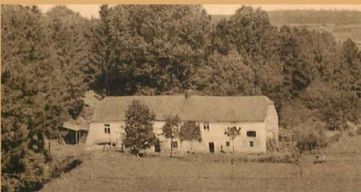
Petit moulin / Kleine molen