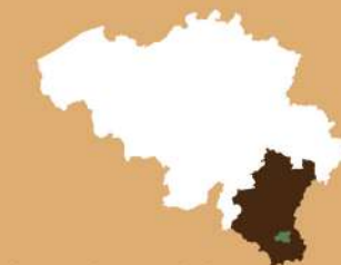
Luxembourg belge Belgisch Luxemburg

In de 17 de eeuw had Rulles twee molens die toebehoorden aan de monniken van Orval. De « kleine molen » gelegen onder de begraafplaats werd gebruikt voor het malen van beukennoten en eikels voor de vervaardiging van olie en van gerst en haver voor veevoer. De « grote molen » werd gebruikt om tarwe en graan te malen tot meel. Het was eveneens op deze plaats dat de gemeenschappelijke molen van Rulles zich bevond. Beide fabrieken staakten hun activiteiten in 1956.