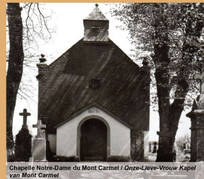
Chapelle Notre-Dame du Mont Carmel / Onze-Lieve-Vrouw Kapel van Mont Carmel

Au 17 e siècle, Rulles comptait deux moulins qui appartenaient aux moines d'Orval. Le « petit moulin », situé en contrebas du cimetière, servit à broyer les faines et les glands pour en faire de l'huile, mais également de l'orge et de l'avoine destinées à l'alimentation du bétail. Quant au « grand moulin », il servit à moulinier le blé et le froment pour en faire de la farine. Ce fut également à cet endroit que se trouvait le four banal de Rulles. Les deux moulins cessèrent leurs activités en 1956.