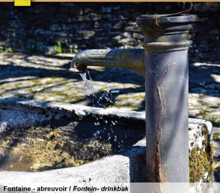
Fontaine - abreuvoir / Fontein - drinkbak