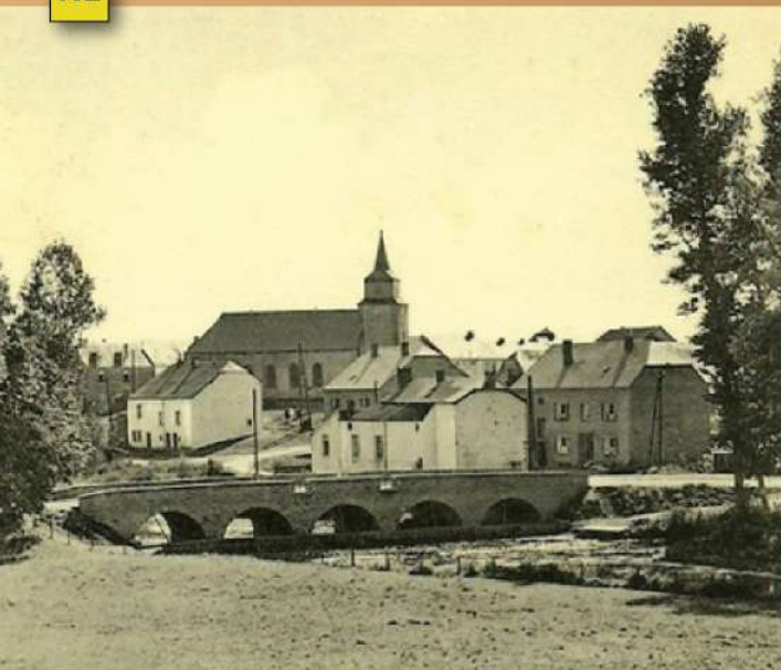
Pont de Rulles / Brug van Rulles