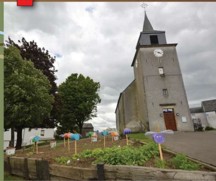
Sorcière et église Saint-Maximin / Sorciere en Sint-Maximin Kerk

1 Calvaire de la Rue du Calvaire Ce calvaire fut établi par l'abbé Doucet en 1953. Cependant, la grande croix en fer forgé est plus ancienne puisqu'elle daterait de 1851. Il est probable que cette croix soit celle de la chapelle de Notre-Dame du Mont-Carmel, forgée par le père de Maurice Grévisse et enlevée lors de la réparation du clocheton.