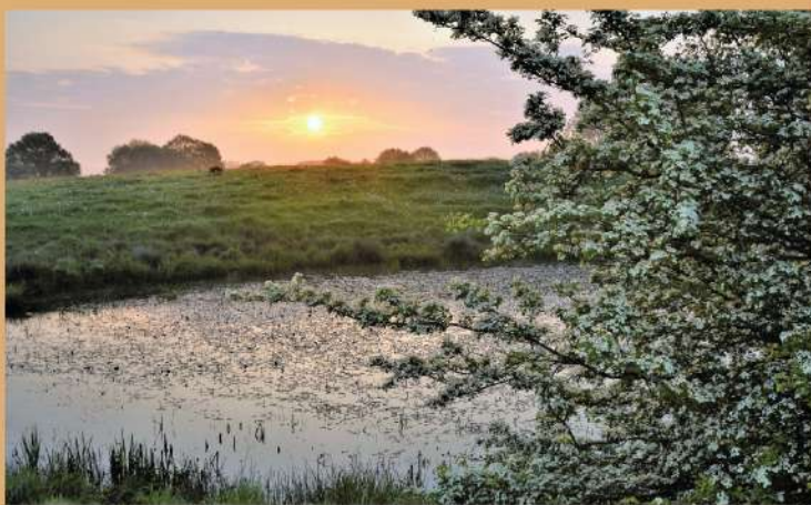
Mardelle / Mardelle

De mardelle is een geologisch fenomeen eigen aan het cuesta reliëf. Ze is kenmerkend voor de marmar- en kleigronden van het secundaire tijdperk. Deze plassen die zijn ontstaan als gevolg van het oplossen van bepaalde kalkhoudende elementen of door instorting, zijn eveneens het gevolg van het afgraven door de mens van turf of slib bestemd om uitgespreid te worden op gewassen. Ze bevatten niet alleen een opmerkelijke flora en fauna maar dienen ook als drinkplaats voor trekvogels.