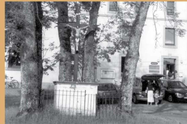
Calvaire de la Rue de la Haise / Openluchtkruis van de Rue de la Haise

6 Mardelle La mardelle est un phénomène géologique propre au relief dit en cuesta. Elle est caractéristique des terrains mameux et argileux de l'ère secondaire. Ces mares apparues suite à la dissolution de certains éléments calcaires ou par effondrement, sont également dues à l'excavation par l'homme de la tourbe ou du limon destinés à l'épandage sur les cultures. En plus de renfermer une flore et une faune remarquables, elles servent de points d'eau pour les oiseaux migrateurs.