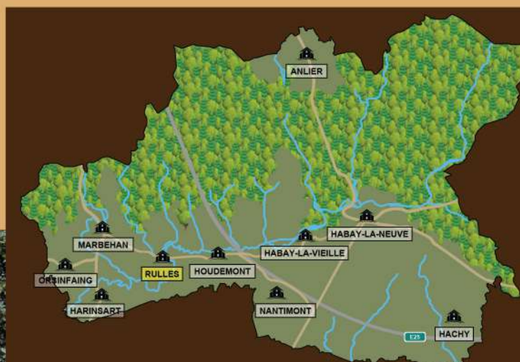
Commune de Habay / Gemeente van Habay